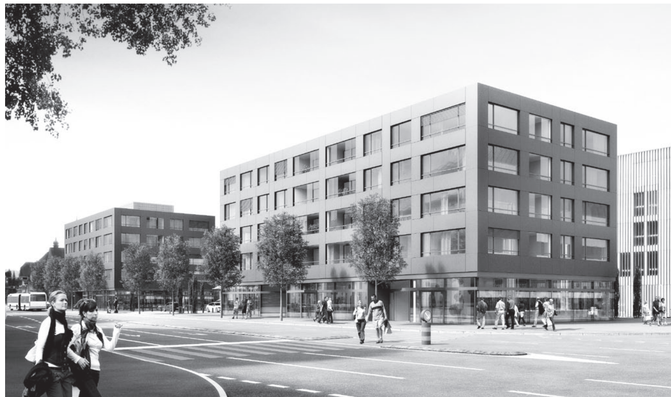
Gesundheitsangebote und Mode – rund ums Riedmatt finden Sie alles für den täglichen Bedarf

Im Zentrum von Ebikon finden Sie zudem alles, was der moderne Stadtbewohner erwarten kann: Post, Apotheke, Ärzte, Fitnesscenter, Coiffeur, Optiker, Bank, Bäckerei, Restaurants und Läden liegen direkt vor Ihrer Haustür. Beliebt ist auch die nur wenige Meter entfernte Ladengasse mit 17 Fachgeschäften, MM Migros, Denner sowie zwei Restaurants. Und auf dem neu gestalteten Stadtplatz zwischen den Gebäuden der Überbauung Riedmatt können Sie gemütlich eine Verschnaufpause einlegen.